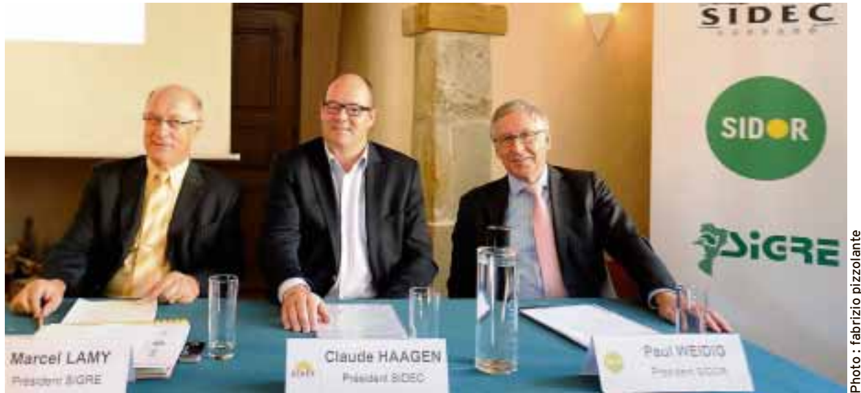
Les trois présidents affichaient une satisfaction unanime et sans réserve hier.

Ce partenariat de coopération a été conclu jusqu'en... 2028.