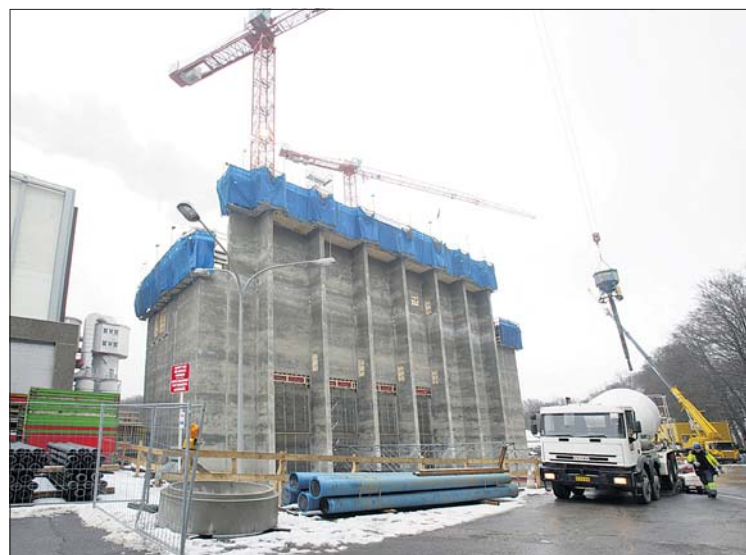
Die Bauarbeiten zum Neubau der Abfallverbrennungsanlage sind bereits in vollem Gange.

Anschließend wurde der Grundstein mit der Jahreszahl 2009, versehen mit einer Zeitkapsel, in der unter anderem auch ein aktueller „Gemengebuet“ der Gemeinde Leudelingen liegt, gelegt.