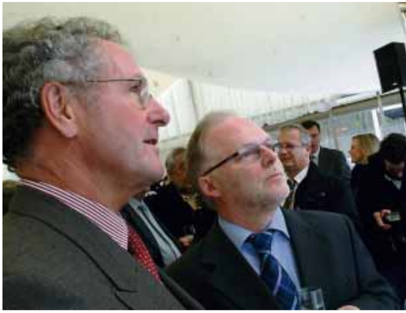
Sidor-Präsident Helming und Umweltminister Lux