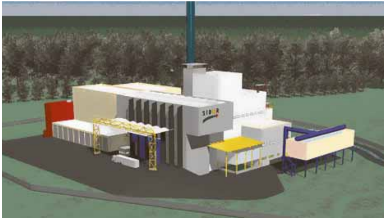
So wird die neue Anlage 2010 aussehen